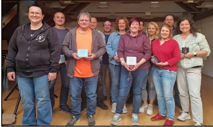
Bild privat - geehrte Mitglieder