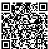
QR-Code: Meldeplattform Asiatische Hornisse

Um möglichst rasch Maßnahmen zum Fang der Königinnen und Beseitigung der Nester der Asiatischen Hornisse zu veranlassen, bittet das Ministerium für Umwelt, Klima und Energiewirtschaft um Meldung von Sichtungen in Baden- Württemberg. Dies ist über die Meldeplattform auf der Homepage der Landesanstalt für Umwelt (LUBW), aber auch über die kostenlose „Meine Umwelt-App“ möglich: