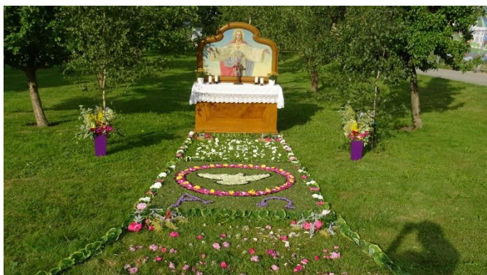
Vergelt's Gott euch Allen !!

schönen Blumenteppeiche, die wieder in vielen ehrenamtlichen Stunden entstanden sind.